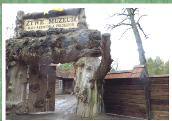
„Żywe Muzeum Wsi i Rzemiosła Polskiego” w Jastkowicach

W Lasach Janowskich odnajdziemy również liczne piękne kapliczki, wśród nich wiele bardzo starych i zabytkowych. Dużą uwagę zwracają także liczne stare krzyże przydrożne (najstarszy z nich znajduje się w Krzemieniu z 1848 r.).